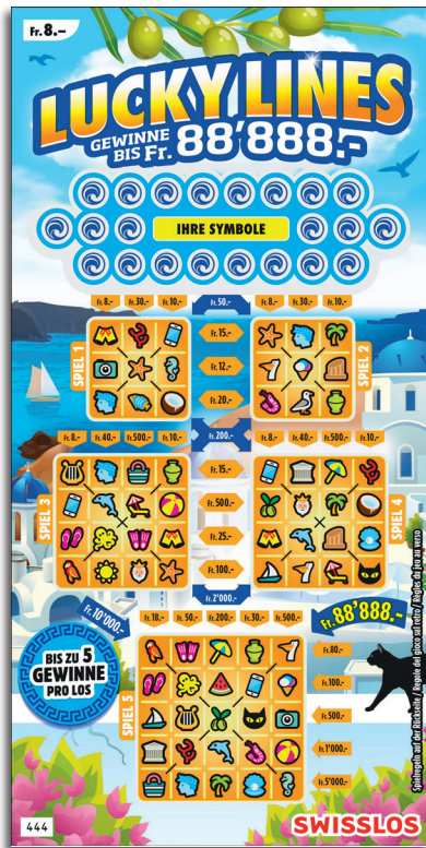
Esempio: La vincita è di Fr. 28.- = (Fr. 8.- + Fr. 20.-)