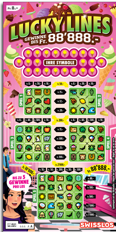
Example: Win Fr. 28.- = (Fr. 8.- + Fr. 20.-)