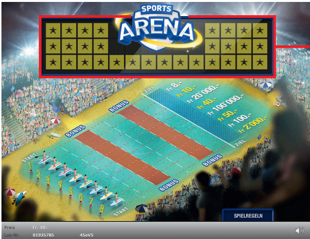
Beispiel: Gewinn Fr. 10.-